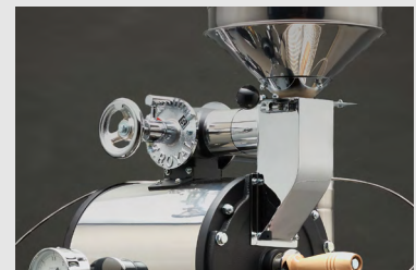
排気調整ダンパー