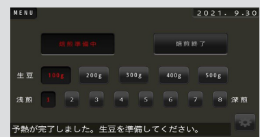
焙煎メニュー機能