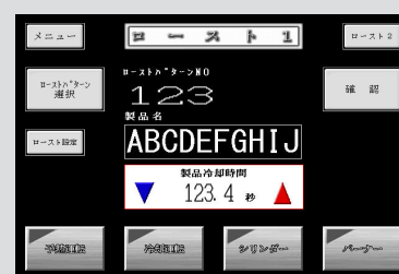
自動ローストシステム