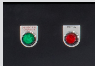
非常消火ボタン / 点火ボタン