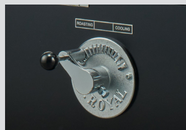
焙煎冷却切り替えハンドル