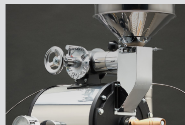
排気調整ダンパー