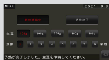
焙煎メニュー機能